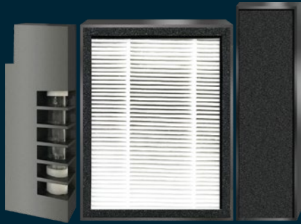
Titanium Pro UV module CHEPA H14 grade filter Gas & Odor filter